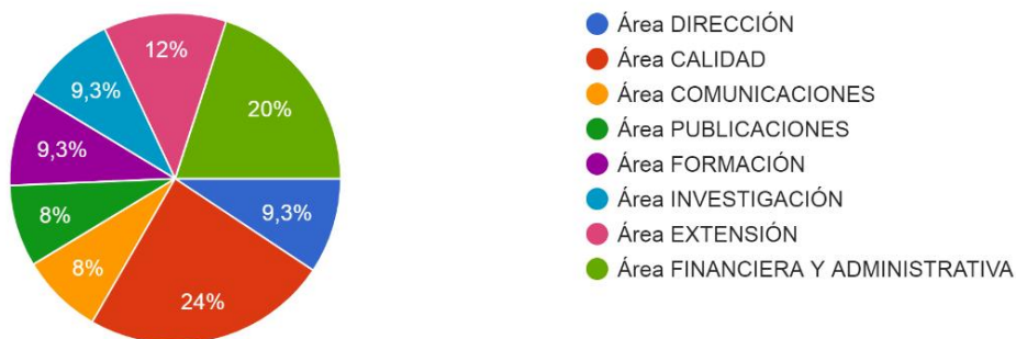
Seleccione Área a EVALUAR: 75 respuestas

– Nivel de Encuestas de Satisfacción al Usuario IEPRI por cada Proceso: Desde el mes de Julio/2020 el SGC–IEPRI diseñó una mejora a las Encuestas de Satisfacción en el sentido de agregarle la posibilidad al usuario de escoger el servicio o trámite que se deseaba evaluar en cada uno de los Procesos, de acuerdo al Inventario de Trámites y Servicios aprobado para el IEPRI mediante Acta No. 2/2020 del Comité de Calidad. Tal y como se decidió en el Comité de Calidad, el análisis de resultados de las Encuestas de Calidad por Proceso, se realizará en el primer bimestre de 2021 y sus resultados y decisiones se consignarán en el Acta respectiva, sin embargo, a continuación se muestra el nivel de respuesta en las Encuestas de Satisfacción a usuarios IEPRI en 2020: